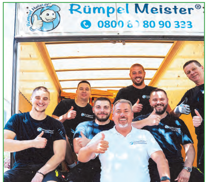
Das Team von Rümpel Meister – bereit für jeden Einsatz, mit Herz und Handwerk.