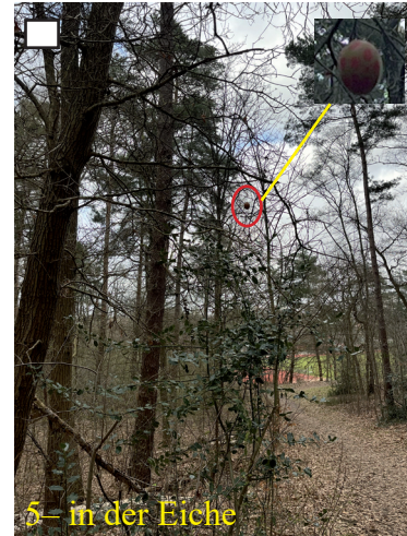
5 – in der Eiche