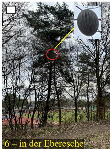
6 – in der Eberesche