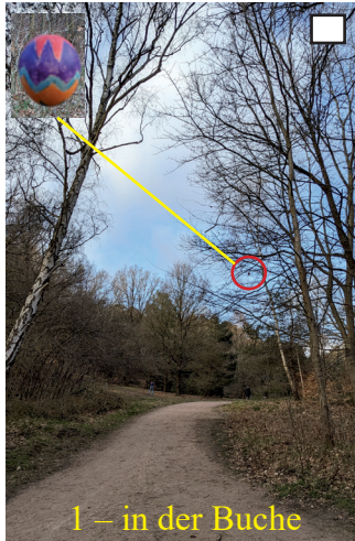
1 – in der Buche

Diese Ostereier in den Bäumen und diese Osternester am Boden habe ich entdeckt: