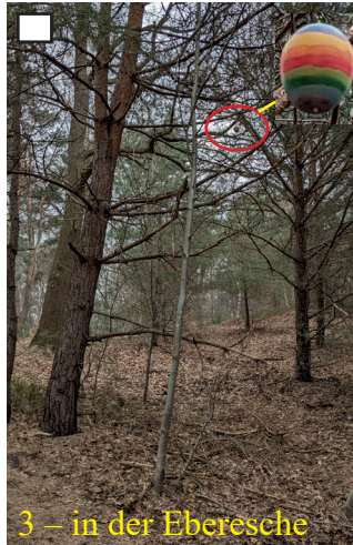
3 – in der Eberesche