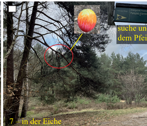
7 – in der Eiche