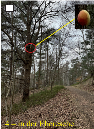
4 – in der Eberesche