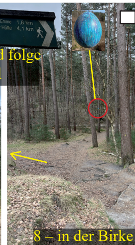
8 – in der Birke