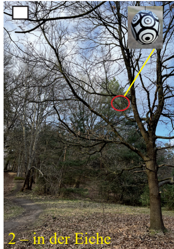
2 – in der Eiche