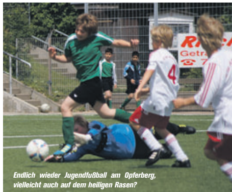
Endlich wieder Jugendfußball am Opferberg, vielleicht auch auf dem heiligen Rasen?

■ (pd) Nach Spielverbot und einem Unentschieden haben die Nachwuchskicker der 1. D-Jugend endlich ein ersehntes Erfolgserlebnis: Überzeugend besiegten sie das Team der HT16 – ganz im FC Bayern Standard – mit 8:1 Toren. Das gibt Motivation für das internationale Pfingstturnier, dem „Nordfrost-Cup“ in Wilhelmshaven, wo die HNT-Fußballjugend mit am Start sein wird. Die neue „Heimat“ für Training und Punktspiel ist für die HNT-Nachwuchs-Fußballjungs und -mädchen übrigens der Sportplatz Opferberg. Die kommende Spielserie geht es auf das 11er Feld, dafür kann noch Verstärkung im Jahrgang 2000 aufgenommen werden. Interessenten melden sich bei Abteilungsleiter Andreas Krahl, E-Mail: fussball@hntonline.de